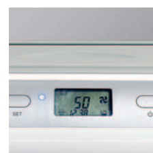
Einstellbarer Hygrostat für die gewünschte relative Luftfeuchtigkeit.