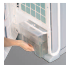
Wassertank mit Sichtfenster 5.5 l.