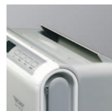
Lüftungsklappe für gezielte Trocknung.