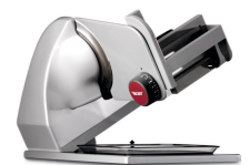
Schwenkfunktion: Die 188 BP kann gerade oder schräg gestellt werden