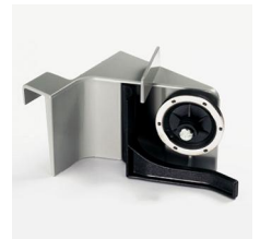
Diamantschleifer für einen garantiert immer scharfen Schnitt