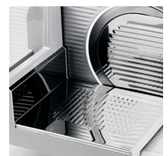
Grossflächiger Schlieten mit 22cm Auszugslänge