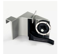
Ideales Zubehör: Diamantschleifer zu CHF 89.-