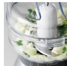
Sonderzubehör Chopper: hackt und zerkleinert

DKB Household Switzerland AG Eggbühlstrasse 28 Postfach 8052 Zürich, Switzerland Tel. +41 (0)44 306 11 11 Fax +41 (0)44 306 11 12 household@dkbrands.com www.turmix.com