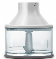
Zubehör Zerkleinerer: Fassungsvermögen 200ml