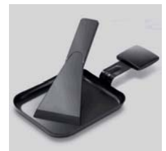
Zubehör: 4 Pfännchen, 4 Schaber

Artikel Nr. _____ A24131 Farbe _____ Chrom / schwarz Verpackungs-Masse _____ B 334 mm / H 166 mm / L 550 mm Verpackungsart _____ Kartonschachtel bedruckt