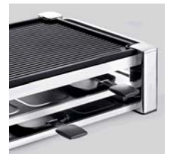
Mit Kaltzone als Pfännchenablage