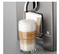
Hochklappbares Abstellgitter für Latte-Macchiato-Gläser