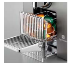
Grosser Kapselauffangbehälter, Fassungsvermögen 14 Kapseln