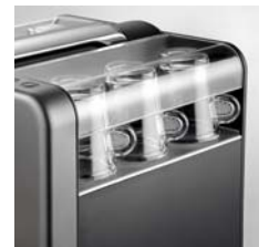
Seitenfächer für bis zu 6 Espresso-Tassen